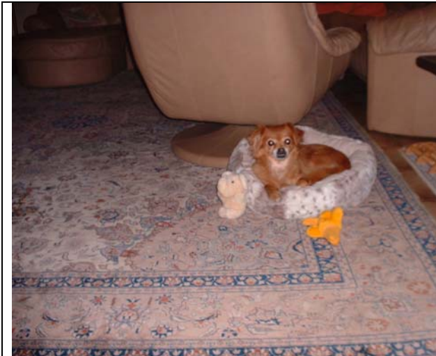
Drei müde Krieger