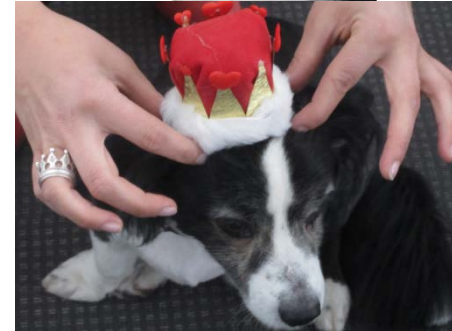
Our Royal Highness „Gremlin“ am 29.4.11 beim Agenturevent William & Kate mit dem „summerlook 2011“.