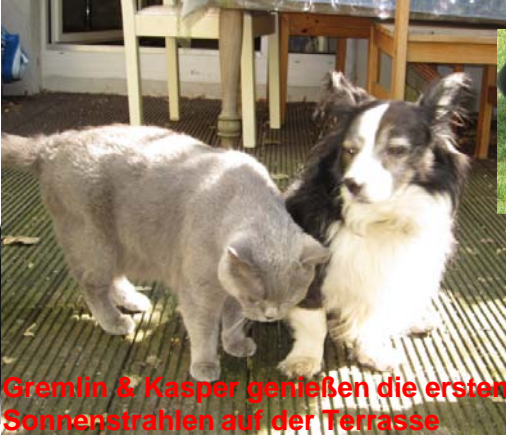
Gremlin & Kasper genießen die ersten Sonnenstrahlen auf der Terrasse