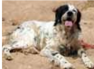
heute so aussieht